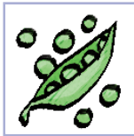
бабовыя гарох, бабы