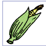
збжжавыя цукровая кукуруза