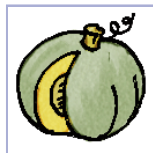
гарбузовыя гарбуз, кабачок, агурок, патысоны, дыня, кавун