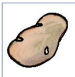
клубняплоды тапіямбур (земляная груша), бульба