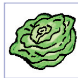
салатныя салата, цыкорый, салата-эндывій