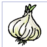
цыбульныя цыбуля, часнок, лук-парэй, шніт-лук, лук-шалот