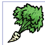
караняплоды морква, буракі, рэпа, бручка, рэдзька, радыска, пятрушка, пастарнак, сельдэрэй, хрэн