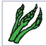
дэсертныя артышок, спаржа, рэвень