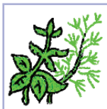
вострыя кроп, эстрагон, чабер, базілік, маяран